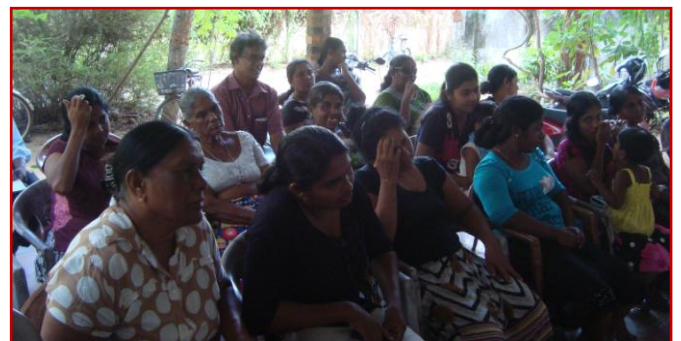
Senakudiruppu at Anuradhapura