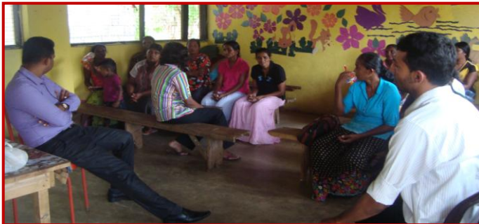
Oyamduwa at Anuradhapura

communities who received their support in finding solutions for socio-economic issues faced by these communities as well as the service providers to whom these communities have been referred. This programme was carried out as a part of the project funded by Fokus.