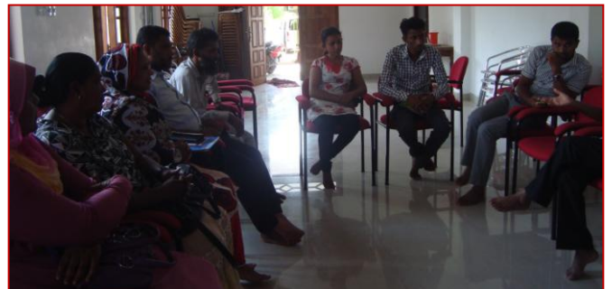
Palaviya at Puttlam