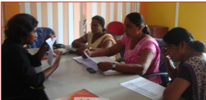
Kekirawa at Anuradhapura